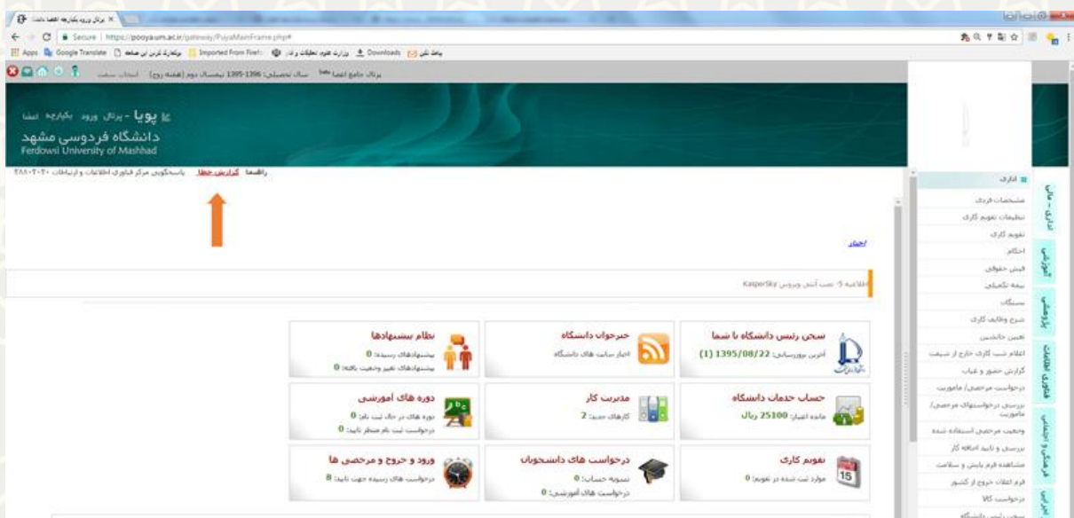
تصویر ۱: پیوند گزارش خطا در پورتال پویا

البته کاربران محترم توجه داشته باشند که برای گزارش مشکلات شبکه و اینترنت، علاوه بر تشریح مشکل و لازم است اطلاعات تکمیلی شامل شماره دانشجویی یا نام کاربری، مکان دقیق مشاهده مشکل (مثلاً نام خوابگاه و شماره اتاق) و زمان آن را حتماً ذکر فرمایند.